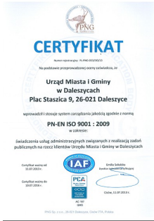
Certyfikat Jakości ISO 9001 PL-PNG-033/ISO/13