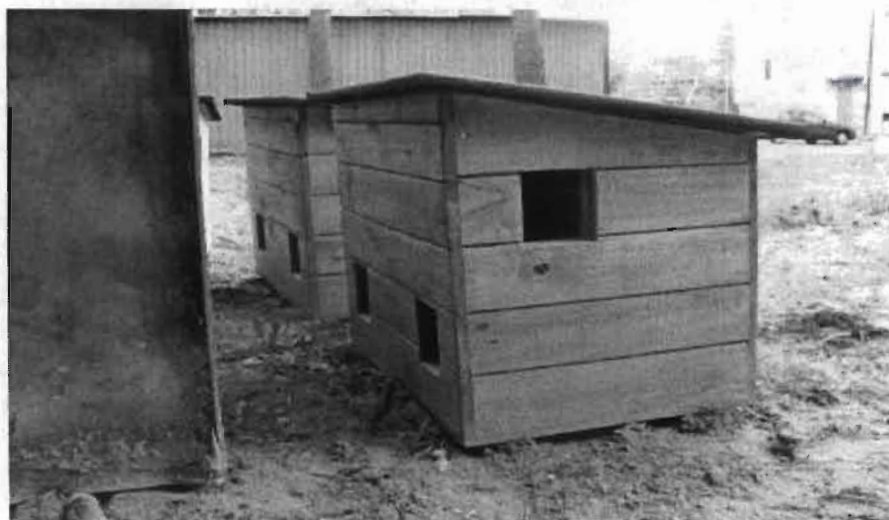
Przykładowe zdjęcie budki dla kotów

w którym karmiciel oświadcza, że jest opiekunem kotów wolno żyjących, oraz że wyraża zgodę na przetwarzanie swoich danych osobowych dla potrzeb wynikających z realizacji Programu.